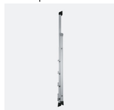
Maksymalne bezpieczeństwo. Brak ryzyka przewrócenia się do przodu.