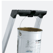
Haczyk do wiadra. Maksymalne obciążenie: 1 kg.