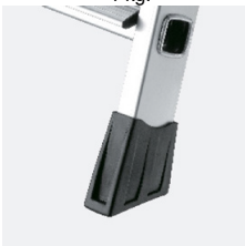
Antypoślizgowe stopki formowane wtryskowo